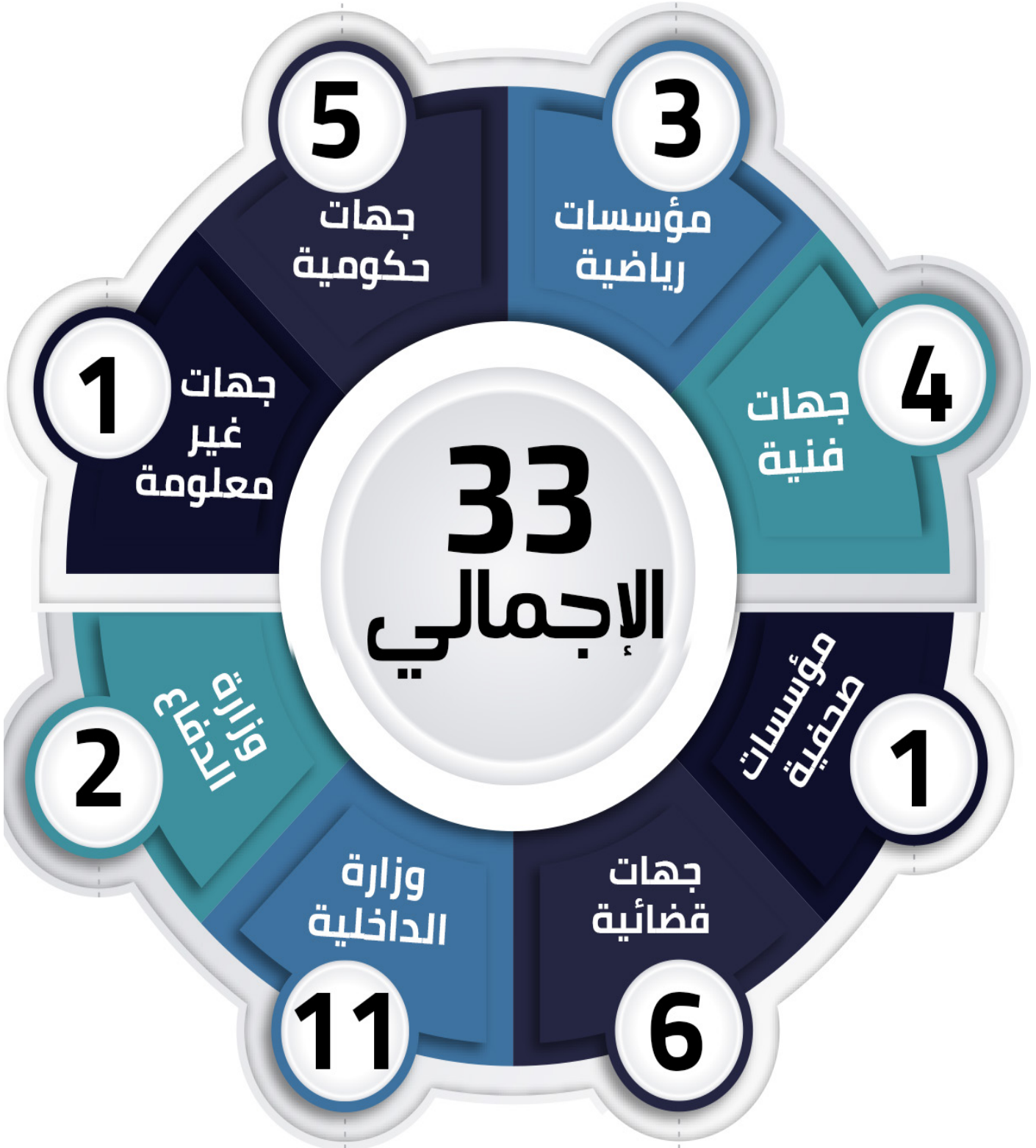
شكل رقم (6) توزيع الانتهاكات وفقاً لجهة المعتدي

جاءت وزارة الداخلية في المرتبة الأولى للفئات الأكثر انتهاكاً لممثلي وسائل الإعلام بواقع (11) حالة، وجاءت في المرتبة الثانية جهات قضائية بواقع (6) حالات، تلاها جهات حكومية بواقع (5) حالات، ثم جاءت الجهات الفنية بواقع (4) حالات، في حين جاءت المؤسسات الرياضية بواقع (3) حالات، وحالتين لوزارة الدفاع، وأخيراً حالة انتهاك واحدة لكل من مؤسسة صحفية وجهة غير معلومة.