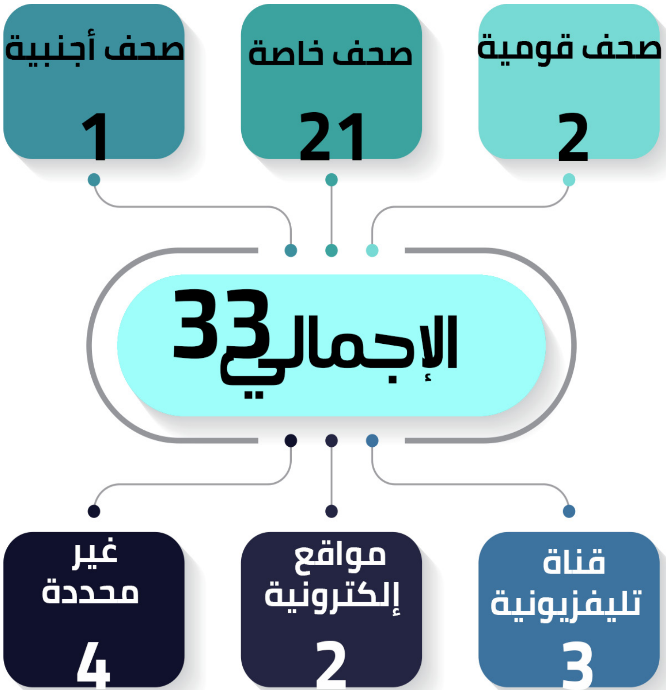
شكل رقم (4) توزيع الانتهاكات وفقاً لجهة عمل الصحفي/الإعلامي

سجل "المرصد" وقائع لعدد من الصحفيين العاملين بقطاعات مختلفة سواء شبكات أخبار، أو صحف مصرية أو قنوات مصرية خاصة وحكومية؛ حيث رصدت الوحدة (21) حالة ضد العاملين بالصحف الخاصة، و(4) حالات لجهات غير محددة نظراً للانتهاكات الجماعية، و(3) حالات ضد العاملين بقنوات تلفزيونية، وحالتين انتهاك ضد العاملين بمواقع إلكترونية، وحالة واحدة ضد العاملين بالصحف الأجنبية.